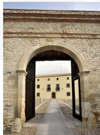
Municipio di Masullas

Costo proposta "Masullas – Area Sancta" € 15,00, comprensivo di biglietti d'ingresso, visita guidata al GeoMuseum, alle chiese ed al centro storico di Masullas, pranzo presso il ristorante "Taraxi"