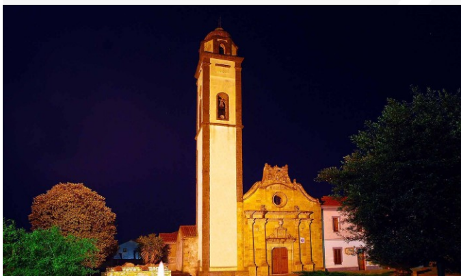
Chiesa Beata Vergine delle Grazie - Sa Gloriosa -, la cui facciata è considerata "la più bella tra le facciate delle chiese esistenti nella diocesi di Ales/Terralba"