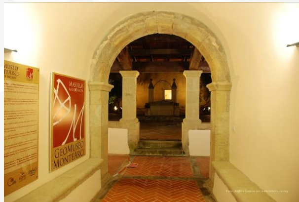
GeoMuseo Monte Arci di Masullas

Per praticare la caccia, ma anche per l'esercizio delle attività più comuni, l'uomo preistorico utilizzava strumenti derivanti dalla lavorazione della pietra e, almeno sin dal tardo-medio Neolitico - cioè 6/8000 anni fa -, utilizzava l'Ossidiana che, in Sardegna, è presente solamente nel massiccio vulcanico del Monte Arci. Nel GeoMuseo Monte Arci di Masullas sono raccontate le vicende geologiche che hanno dato origine all'Ossidiana, mentre nel Museo dell'Ossidiana di Pau sono rappresentati gli aspetti scientifici, naturalistici, tecnologici, sociologici e storici dello stesso materiale.