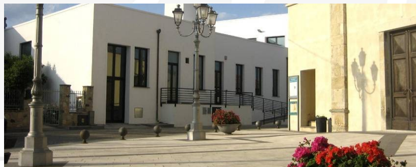
Museo dell'Ossidiana di Pau

Costo proposta "MUSEI del MONTE ARCI" € 15,00, comprensivo di biglietti d'ingresso, visita guidata al GeoMuseo di Masullas ed al Museo dell'Ossidiana di Pau e pranzo presso il ristorante "Taraxi"