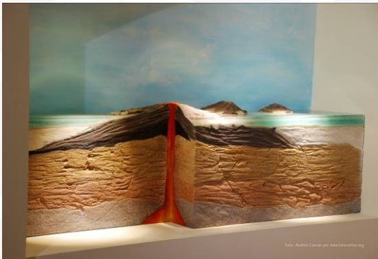
GeoMuseo Monte Arci

A Masullas, in località Conca Cannas , esiste il più grande giacimento di Ossidiana di tutto il Mediterraneo, tuttora aperto al pubblico e nel quale si può verificare ed apprezzare la bellezza del minerale, in un contesto ambientale e paesaggistico di raro pregio.