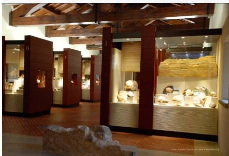
GeoMuseum Monte Arci

Sin dal periodo bizantino in Sardegna (460 d.C. – 900/1000 d.C.), nel territorio di Masullas, si ha una forte testimonianza del processo di cristianizzazione. Sono diversi i siti in cui furono edificati luoghi di culto attribuiti a quel periodo storico (Santu Stevini, Santu Miali, Santu Gromai). Seguirono la costruzione dell'abbazia Vallombrosana di San Michele in Thamis, la chiesa di San Leonardo, di San Vito, di Santa Lucia, di S. Maria di Fraus, della parrocchia B.V. delle Grazie "Sa Gloriosa", del Convento dei Cappuccini e dell'annessa chiesa di San Francesco. E' ampiamente documentato che la sede della diocesi di Terralba "non fu sempre in questo villaggio, ma prima dell'unione fattane nel secolo XVI alla chiesa vescovile di Ales/Usellus, risiedevano i vescovi nel villaggio di Masullas"