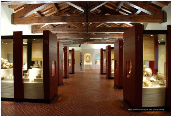
GeoMuseo Monte Arci

Nel laboratorio realizzato all'interno del GeoMuseo è possibile dedicare ai bambini e ragazzi delle scuole una particolare attenzione all'attività didattica, e si potranno conoscere, attraverso degli esperimenti, le proprietà dei diversi minerali conosciuti durante il percorso museale.