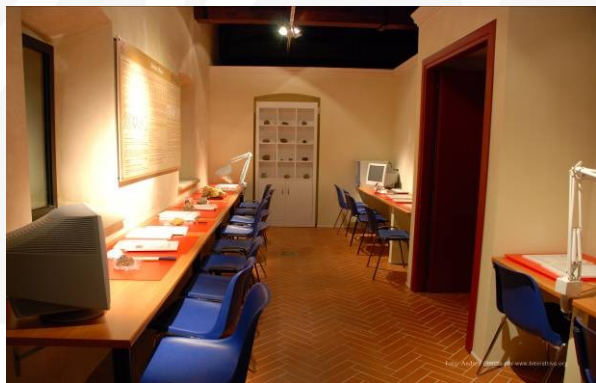
GeoMuseo Monte Arci - Aula didattica

Costo proposta "Futuro geologo" € 15,00, comprensivo di biglietti d'ingresso, visita guidata al GeoMuseo, assistenza nelle attività didattiche e pranzo presso il ristorante "Taraxi"