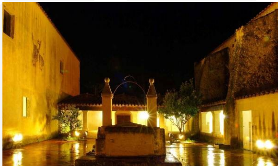
Chiostro ex Convento dei Cappuccini