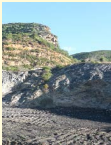
Lavori di sistemazione area di Conca 'e Cannas

principali opere pubbliche realizzate seguendo il principio "LA PAROLA AI FATTI".