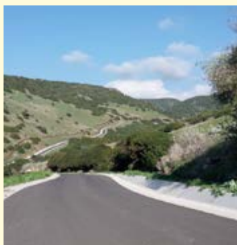
Manutenzione straordinaria, realizzazione sistema di raccolta acque, bitumatura della strada Tapoi per la "Casa del cacciatore" e Campuanni