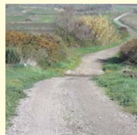
Sistemazione strade rurali