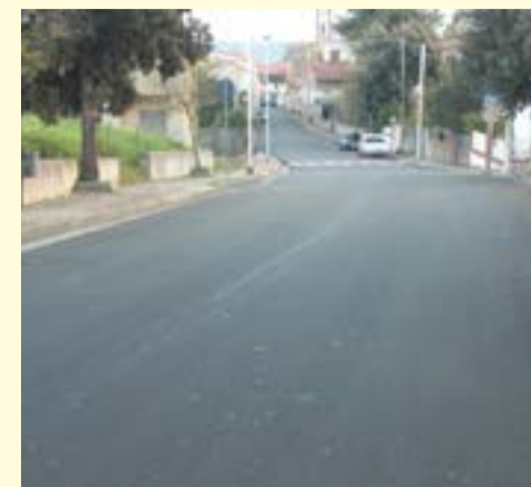
Bitumatura, sistemazione e rifacimento segnaletica orizzontale strade interne