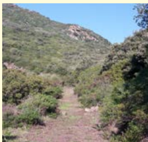
Ripristino antichi sentieri