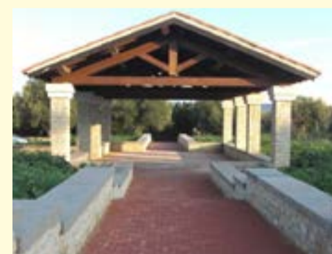
Realizzazione spazio coperto e parcheggi a servizio del parco giochi comunale